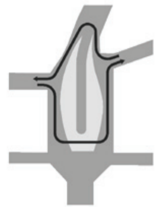
Vorher Wenig und umständliche Querrungsmöglichkeiten