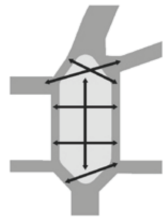
Nachher Vielfältige und direkte Querrungsmöglichkeiten